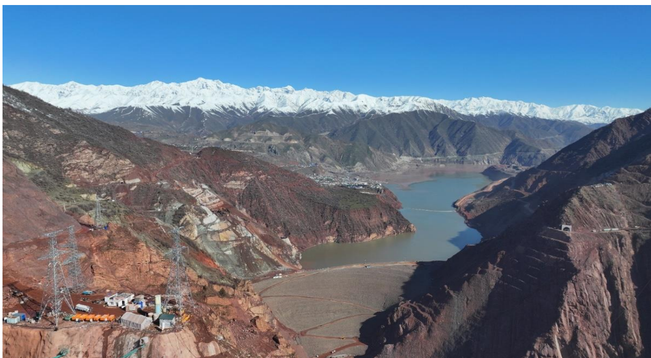
Расми 2. Сарбанди Неругоҳи Роғун.

Хобонидани маводи шағал дар зонаи 4 ва маводи филтр дар зонаҳои 2 ва 3 қисмати поёнии таҳкурсии ядроӣ сарбанд дар сатҳҳои 1004м-1011м идома дошта, дар се моҳи соли ҷорӣ дар ҳаҷми – 306911м 3 мавод хобонида шудааст.