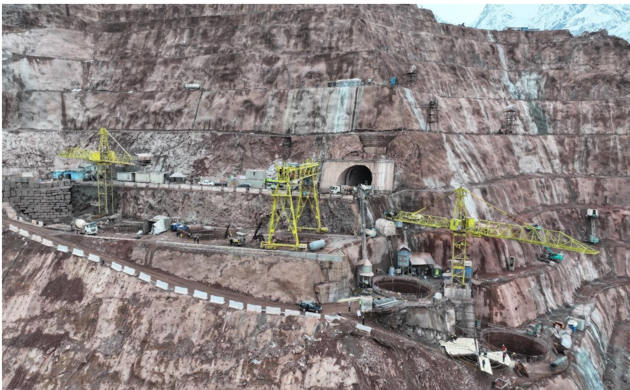
Расми 5. Ҷараёни корҳо дар обқабулкунакҳои доимӣ.

Дар иншооти камераи васлгари турбинаҳо, сатҳи 1171м, корҳои хобонидани бетони конструктиви девораҳо ба анҷом расида, ду адад крани борбардор васлу насб ва ба кор омода карда шуд. Дар ин толор айна замон корҳои бетонхобонии қисмати каф дар мавзёи шахтаҳои обрасони агрегатҳои №5 ва №6 давом мекунад.