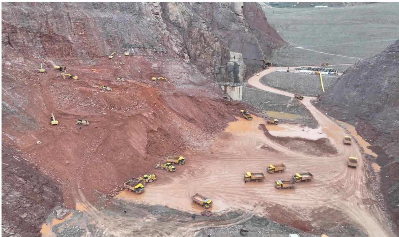
Расми 3. Тозакунии паҳлуи рости куҳ дар минтақаи ядрои Сарбанд.