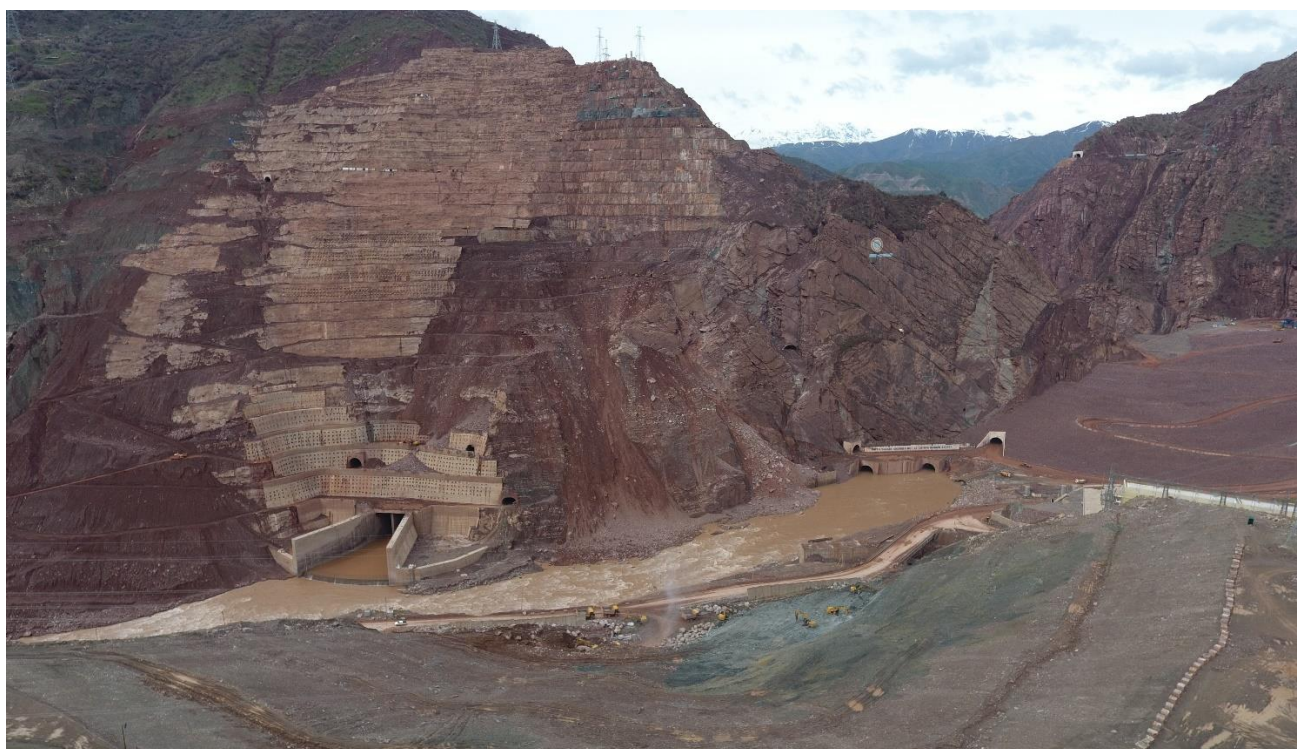
Расми 4. Баромадгоҳи нақбҳои сохтмони СТ-3 ва СТ-4.

Корҳои ҳаффории нақбҳои дастрасии сементатсионии АГ2R, нақби сементатсионии G-1R ва G-3R соҳили рост ба анҷом расидааст.