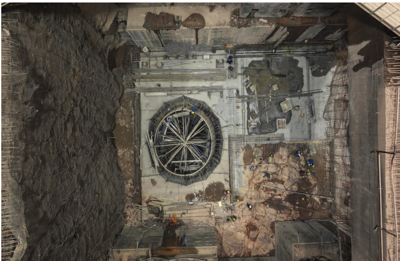
Расми 6. Арматурбандии атрофи конуси агрегати №3.

Қорҳои нақбкани ва бетонхобонӣ дар нақбҳои сементатсионии G2L, G3L ва G4L соҳили чап давом мекунанд.